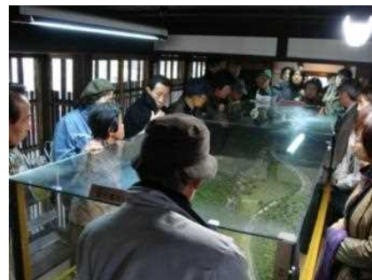
案内の様子。地域の概要説明では、「京都市嵯峨鳥居本町並み保存館」にあるジオラマを活用します。