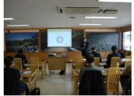
専門家を招いての講演会