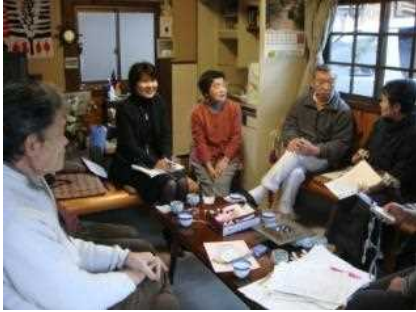
膝詰めで行う小規模なワークショップを何度も開催してきました

地域の方々、そして NPO や保勝会のメンバーでは、愛宕街道の魅力を再発見し共有するとともに、来訪者の目線で課題を発見していくワークショップを開催してきました。建築家や郷土史家など各種専門家を招いた講演会等もこれまで幾たびも実施してきました。その中で「嵯峨鳥居本について詳しく解説している英語ガイドブックは、実は少ない」「歴史文化をいかしたまちづくりと観光地づくりの両立の秘訣」などの新たな気付きがありました。また、ワークショップは地域の内外の人が話し、交流する機会にもなっており、外の目線からこの地域の魅力を改めて聞かされることによる再発見も重ねられています。