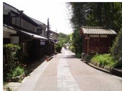
左側の建物が「京都市嵯峨鳥居本町並み保存館」