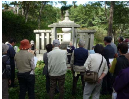
南部藩士墓所の説明