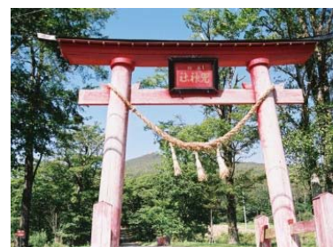
霊山・兜明神岳と兜神社(宮古市)