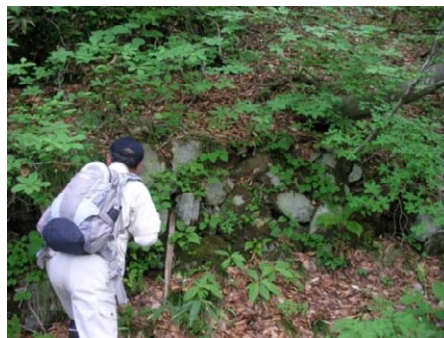
明治の道の道路擁壁の調査