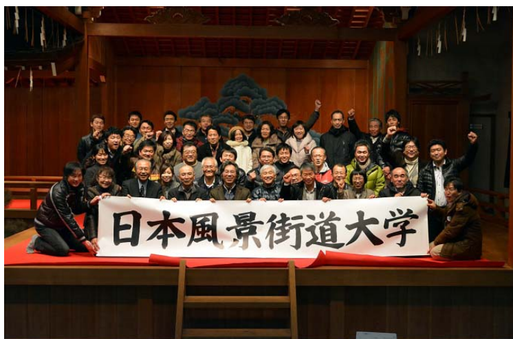
能楽堂の舞台を会場に最後の講義が終了し、達成感の笑顔あふれる記念写真