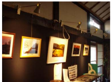
古民家ギャラリー