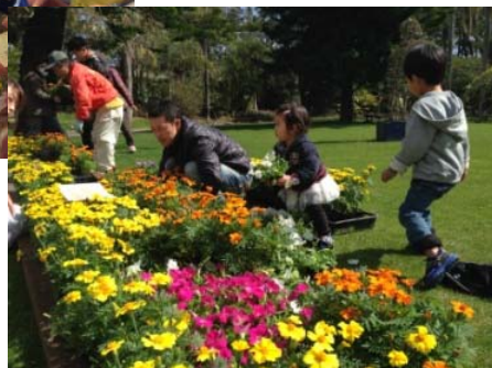
オープニングイベントの会場づくりも市民参加で「みんなでつくろうフラワーカーペット」