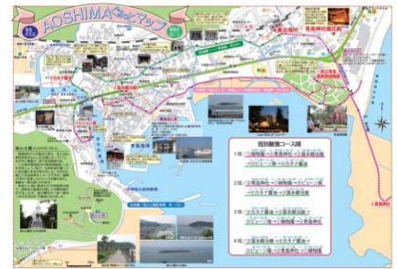
地域がつくった「まちあるきマップ」

南海トラフ・日向灘沖などの大地震は、長いサイクルで起きる。この地域のように、過去の災害の教訓を元に何百年も後世に伝え続けることの大切さ、そして、その手法などを学んだ。