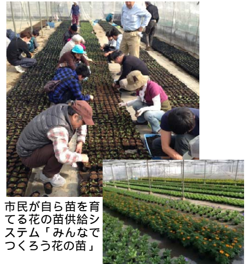
市民が自ら苗を育てる花の苗供給システム「みんなでつくろう花の苗」

植栽活動に必要な花苗はルート全体で2万株を超える。そのうち1万数千株は、市民が自ら生産した花苗で賄っている。