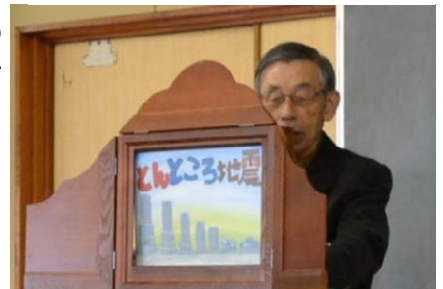
紙芝居で伝える津波防災教育