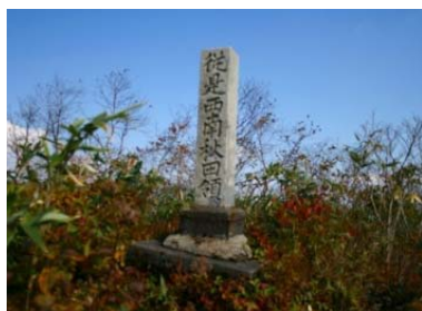
秋田藩と盛岡藩の藩境に立つ碑