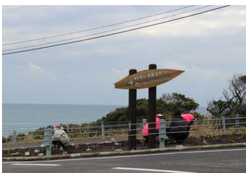
展望台への案内看板を設置