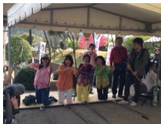
もてなす側ともてなされる側と一緒に記念写真