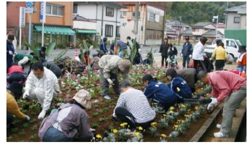
国道の分岐交差点を花壇で彩る活動

そこには、花やみどりで彩った美しい街並みや集落で、訪れる人々を出迎えたいという思いから、プランターや花壇に花を植え、水をやり、雑草をむしっている人々がいるのである。