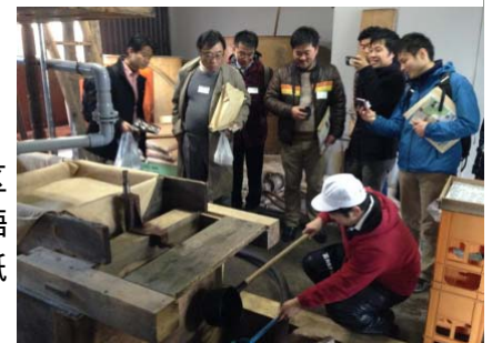
江戸時代からの製法を守る醤油蔵