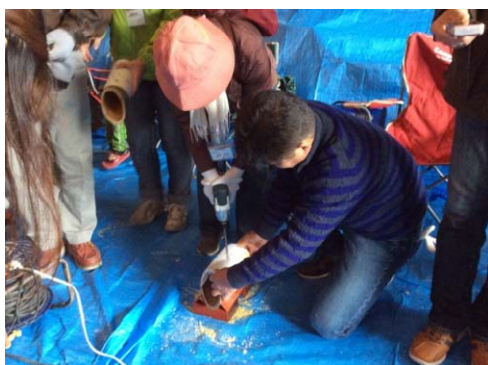
竹灯籠づくり体験