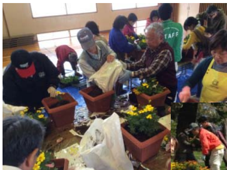
家々の門を飾るプランターづくり「まちかど寄せ植え教室」

日南海岸きらめきラインでは、自治会や学校に活動のチラシを配布し、活動団体だけではなく、地域住民が活動の主役になれるような工夫をしている。