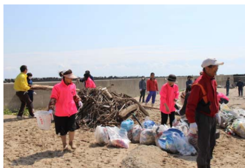
サーフィンスポットのビーチクリーン