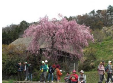
枝垂れ桜を満喫する参加者