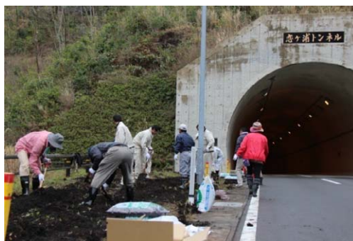
沿道にカナナを植える活動