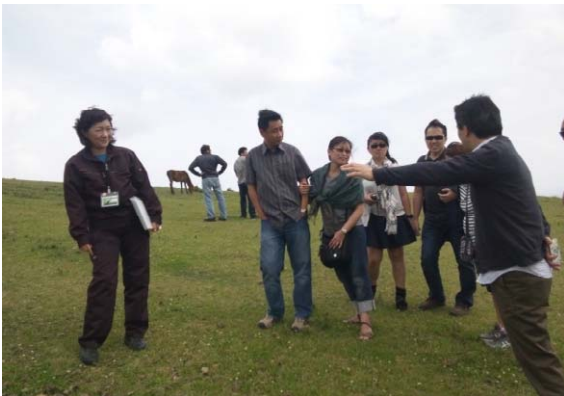
都井岬野生馬の生態を語るガイドの話にツアーも盛り上がる