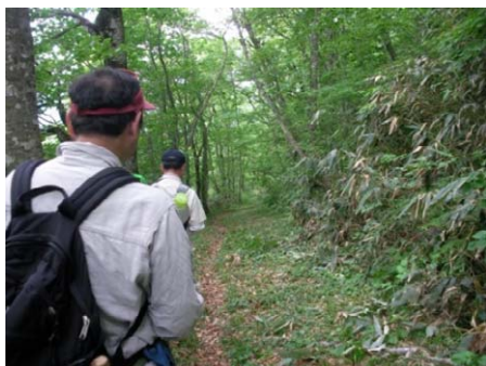
歴史街道(明治の道)の実地調査

国見峠・仙岩峠には江戸時代と明治時代に利用されていた道がそれぞれ残されており、当時の痕跡を大いに感じることが出来ます。一般参加者を対象とした探訪会等も実施しており、歴史街道に詳しい先生をお招きして秋田街道の魅力を伝える活動や、ホームページを利用した情報発信を展開しています。