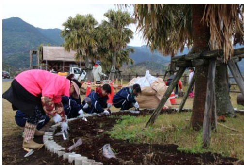
トンネルが開通し、バイウェイになった展望台(ポケットパーク)にカナナを植える活動