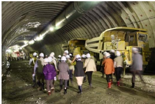
宮古盛岡横断道路 新川目トンネルの見学

前回(平成 25 年 10 月)実施の 106 の日ウォークでは、「復興支援道路」として整備が進められている「都南川目道路 新川目トンネル」の工事現場見学を通して国道 106 号の必要性・重要性を考えたほか、盛岡市にある寺院で宮古に深いゆかりのある聖壽寺・東禅寺の見学を通して旅日記の舞台である江戸時代の情緒に触れることが出来ました。このイベントは参加者を一般募集していますが、大変好評を頂き、例年多数の方に御参加いただいております。