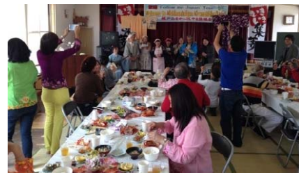
地元がもてなす漁師料理は大好評