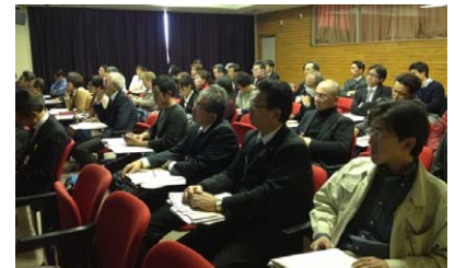
多彩な講師陣の講義に、参加者も興味津々