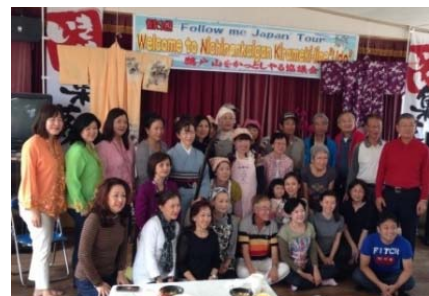
もてなす側ともてなされる側と一緒に記念写真