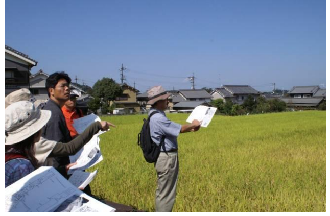
語り部つあー（明日香村周辺）