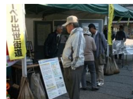
風景街道紹介ブース