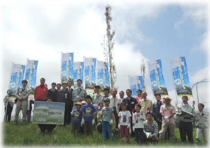
北海道コカ・コーラボトリング(株)様との共催記念植樹

今年度は(株)ニトリ様、(有)高橋商事様からご協力を頂くとともに、北海道コカ・コーラボトリング(株)様の賛同と企業協賛による初めての共催記念植樹もおこなわれました。今後も地域や企業との連携を強め、引き続き植樹や維持管理を行っていく予定です。