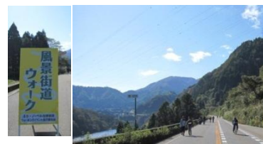
国道ウォーキングの様子

また、風景街道の紹介ブースでは、本ルートの紹介だけでなく飛騨地域のルートのパンフレットやパネルを展示し、PRを行っています。