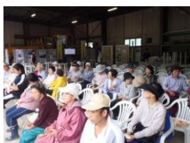
除雪 ST 活用状況