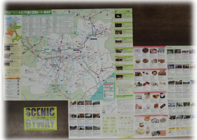
トカプチ雄大空間ルートマップ (B2 版両面)

「トカプチ雄大空間の魅力をわかりやすくひとまとめにし、情報を発信したい」、そんな想いで「トカプチ雄大空間ルートマップ」は作られています。地図はもちろん、ルート内の観光ポイントやお食事処、ドライブルートの案内等、B2版両面に情報がぎっしり詰まっており、観光客の方々にたいへん好評です。平成24年度は7万部が発行され、十勝を訪れる方々の観光ナビゲーターとして利用されており、今後も、より利用しやすい魅力的なマップを目指して、見やすさの向上や、情報の充実などを図っていく予定です。