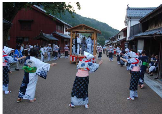
鯖街道総踊り（それぞれの浴衣で踊りました。）