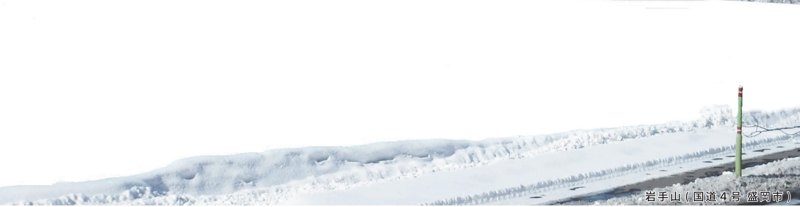
岩手山（国道4号盛岡市）