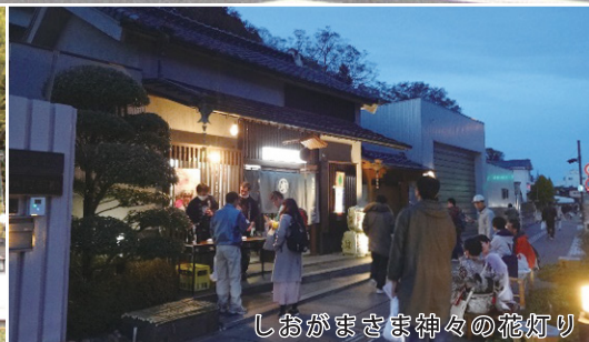
しおがままつり神々の花灯り