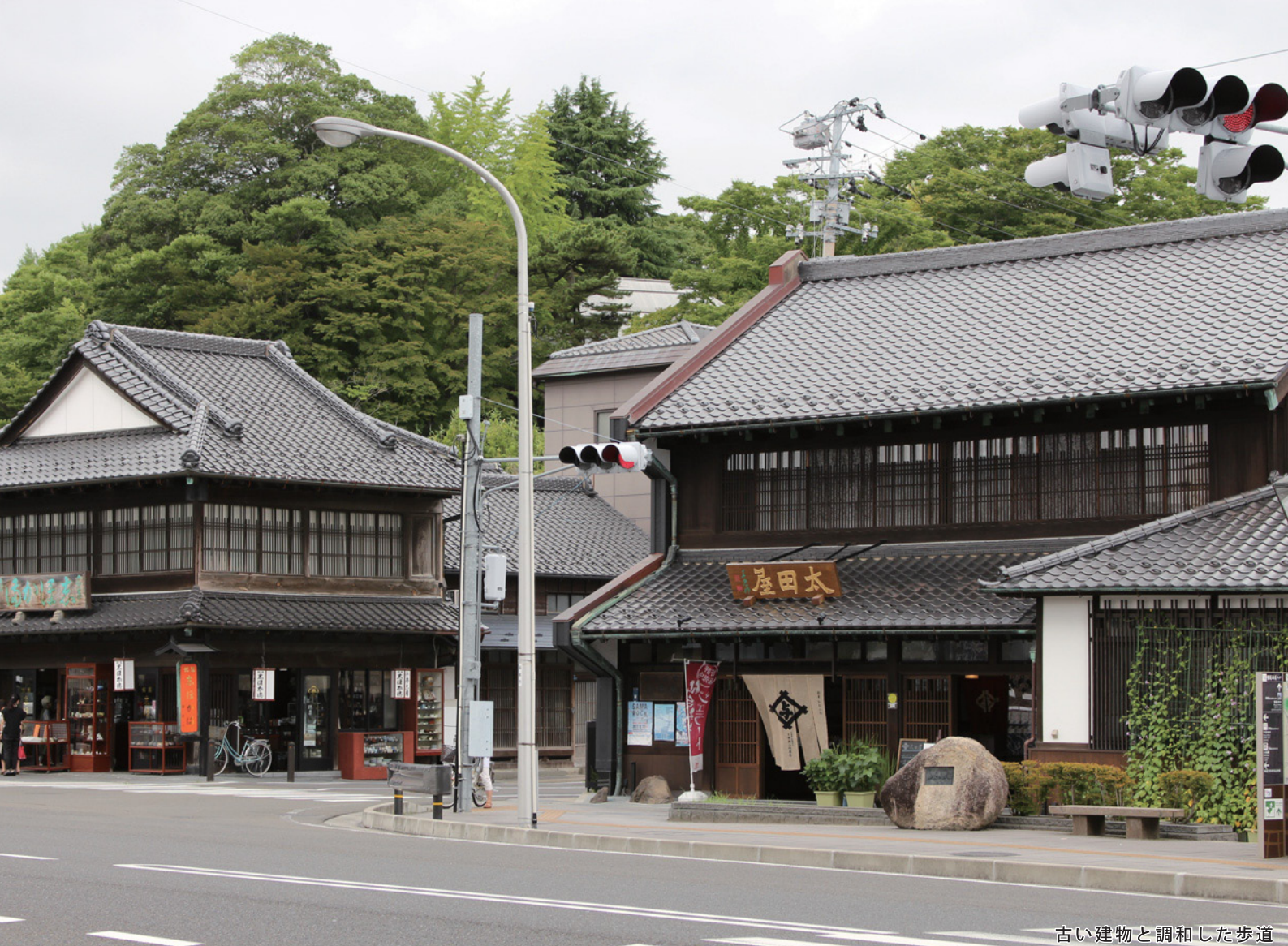
古い建物と調和した歩道