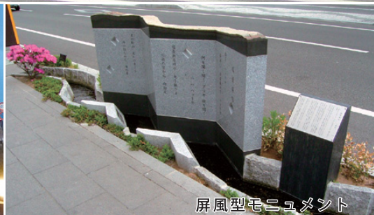
屏風型モニュメント