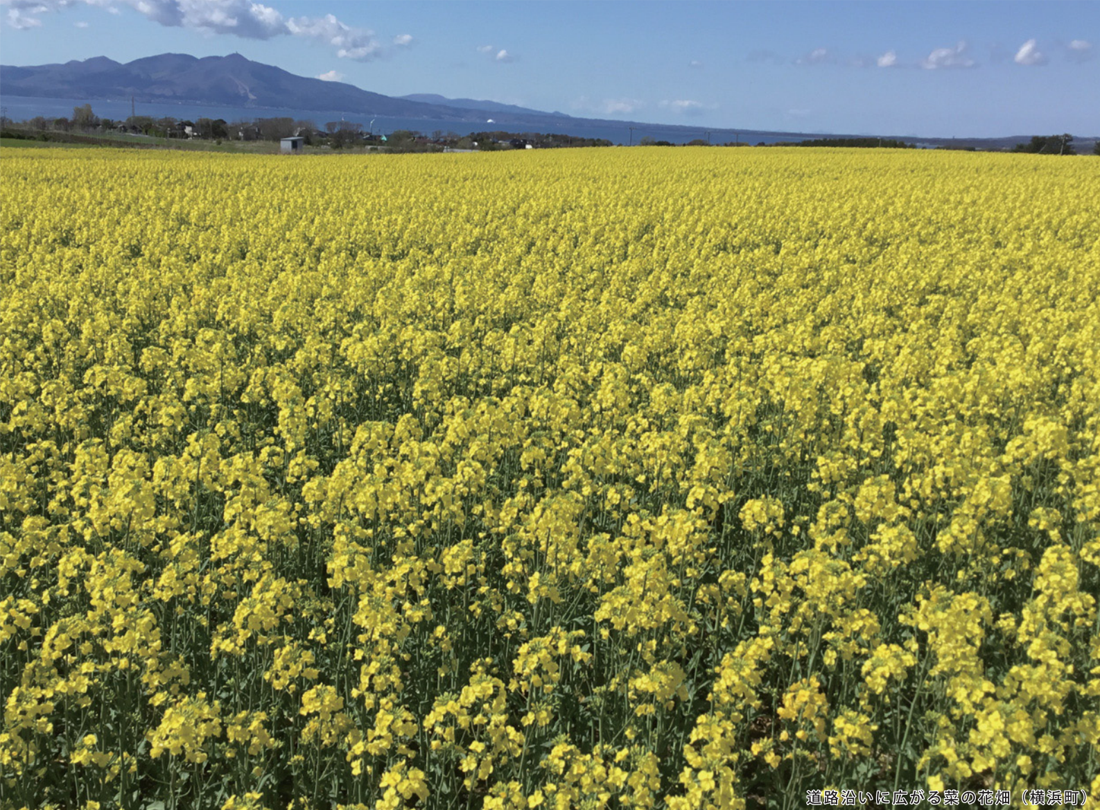
道路沿いに広がる菜の花畑（横浜町）