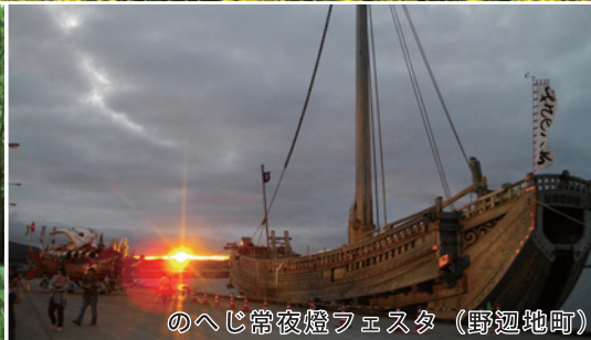
のへじ常夜燈フェスタ（野辺地町）