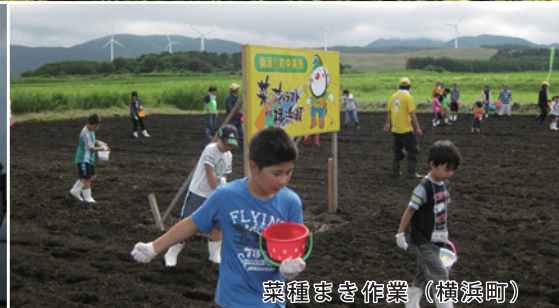
菜種まき作業（横浜町）