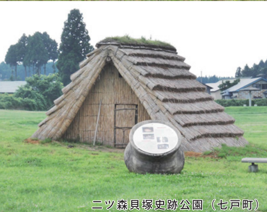
ニツ森貝塚史跡公園（七戸町）