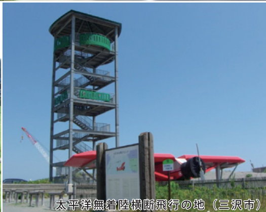
太平洋無着陸横断飛行の地（三沢市）