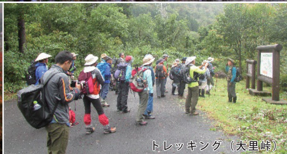
トレッキング（大里峠）