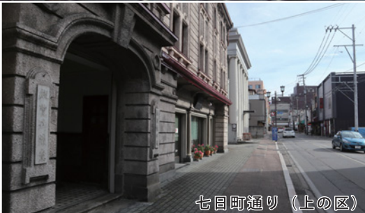
七日町通り (上の区)