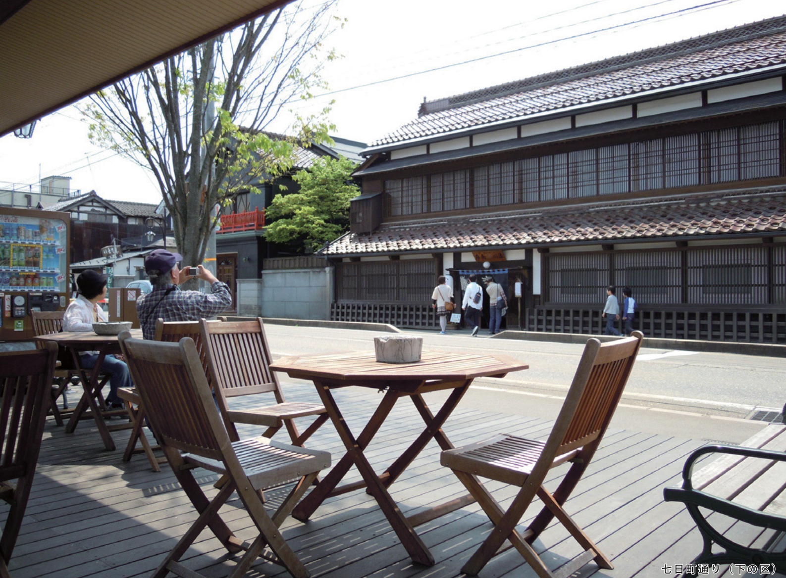
七日町通り (下の区)