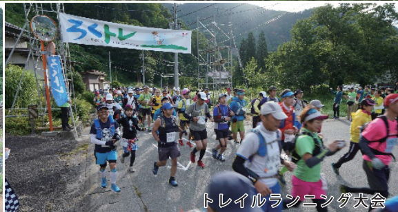
トレイルランニング大会