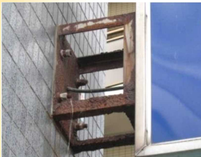
ブラケットの腐食による落下の危険のある看板