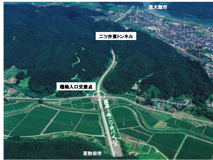
▲国道7号ニツ井バイパス