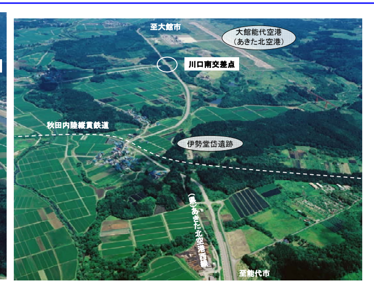
▲(県)あきた北空港西線