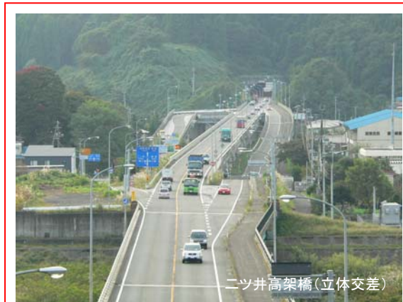
ニツ井高架橋(立体交差)