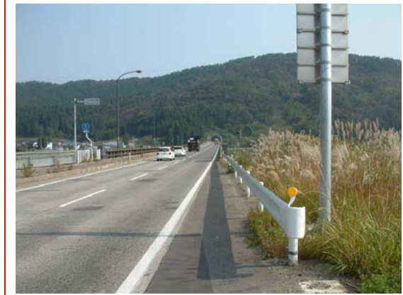
▲国道7号ニツ井バイパス