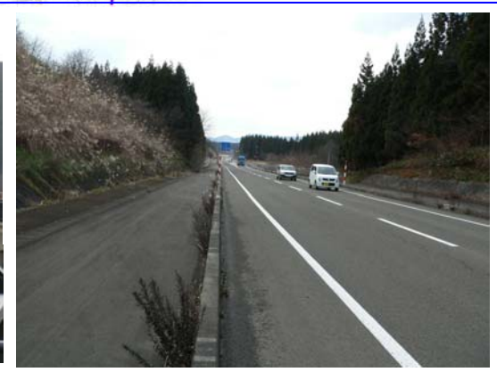
▲(県)あきた北空港西線