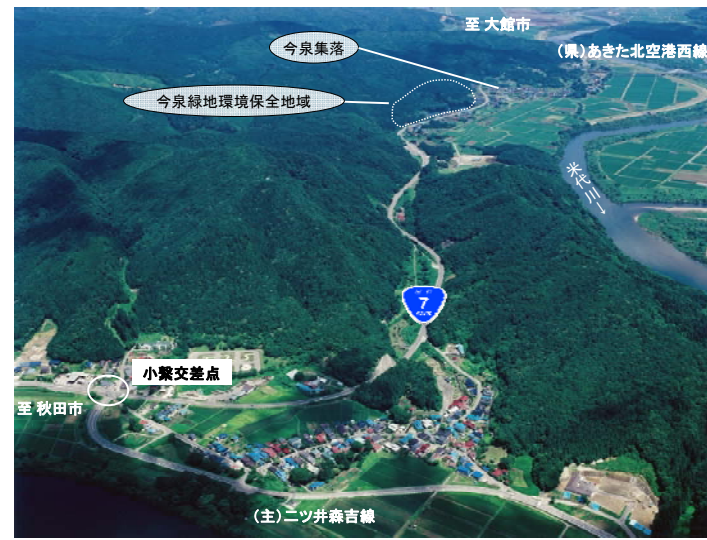
▲国道7号小繫～今泉地区