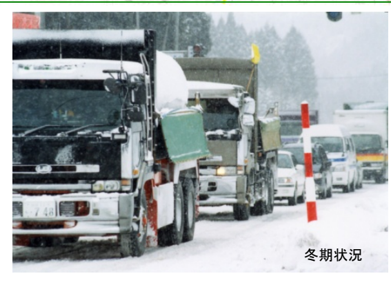
▲国道7号(小繫～今泉地区)