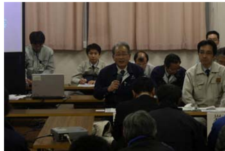
▲宮古市副市長の挨拶