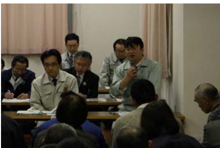
▲岩手河川国道事務所副所長の挨拶