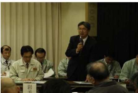
▲岩手河川国道事務所長の挨拶