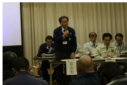
▲宮古市総務企画部長の挨拶