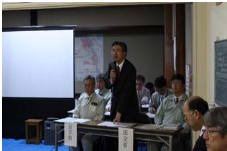
▲岩手河川国道事務所長の挨拶