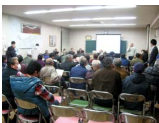
説明会全体の様子