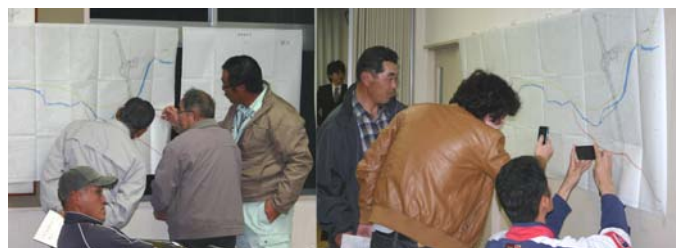
設計図面を見る参加者