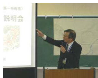
磐城国道事務所副所長のあいさつ