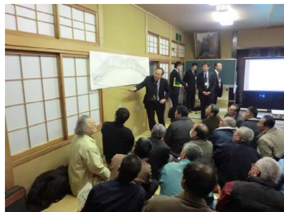
▲調査範囲の説明状況