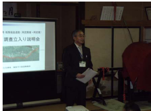
▲福島河川国道事務所副所長の挨拶