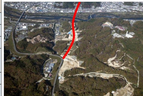
宮古中央IC付近(北側を望む)