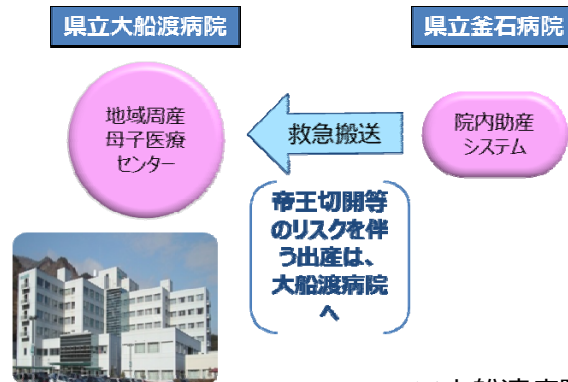
▼産婦人科医療の地域機能分担イメージ