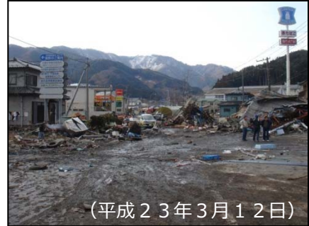
▼写真②（釜石市唐丹地区）