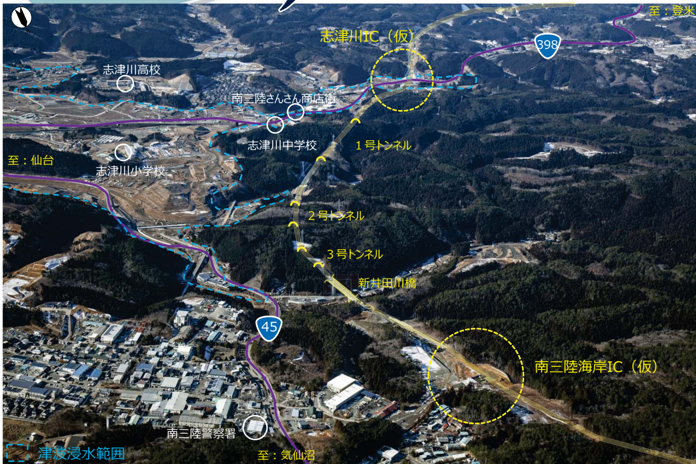
【撮影時期：平成28年1月】

三陸沿岸道路「登米志津川道路」は、地域の皆様に見守られながら、工事を進めてまいりました。これからも、応援をお願いいたします。