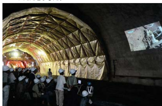
▼H25.7.14 志津川トンネル現場見学会 登米市東和町米谷地区の皆様に参加していただきました。