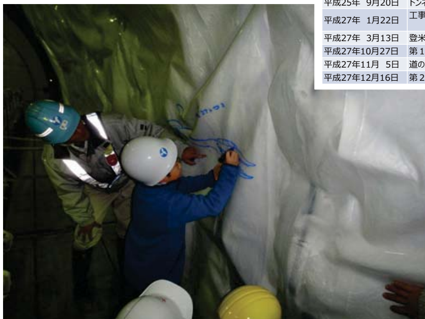
▲H24.11.25 志津川トンネル現場見学会 南三陸町入谷・岩沢地区、登米市米谷自治会の方々に参加いただきました。