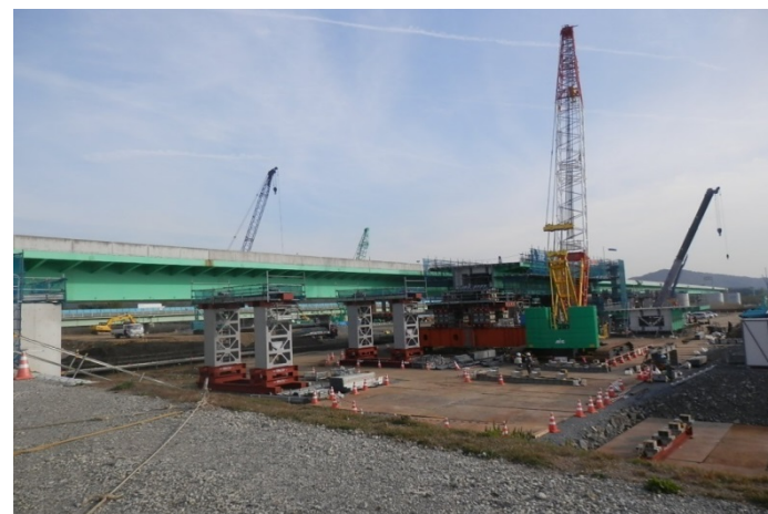
▲矢本石巻道路(新天王橋)の4車線化工事状況