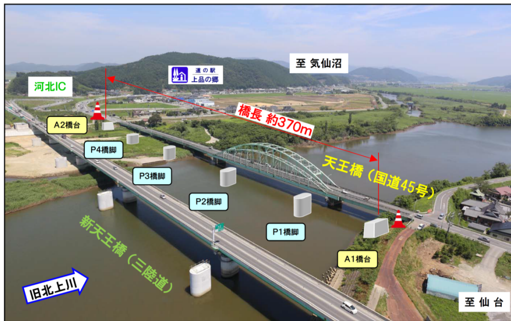
▲ 国道45号 天王橋の架替え

昭和34年に架橋した天王橋は、竣工後55年が経過し部材損傷が著しく、かつ車道幅員が6.0mと狭小のため、車両の大型化に伴いスムーズな通行ができない状況にあります。また、東北地方太平洋沖地震では、橋桁の著しい損傷等を応急復旧しているものの、今後の大規模地震に向けた耐震化を目的とする架替え事業です。