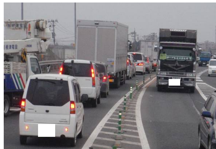
▲矢本石巻道路の混雑状況