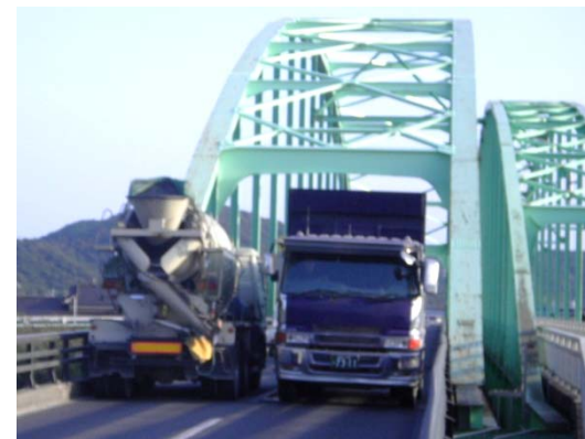
▲ 大型車両同士の通行状況