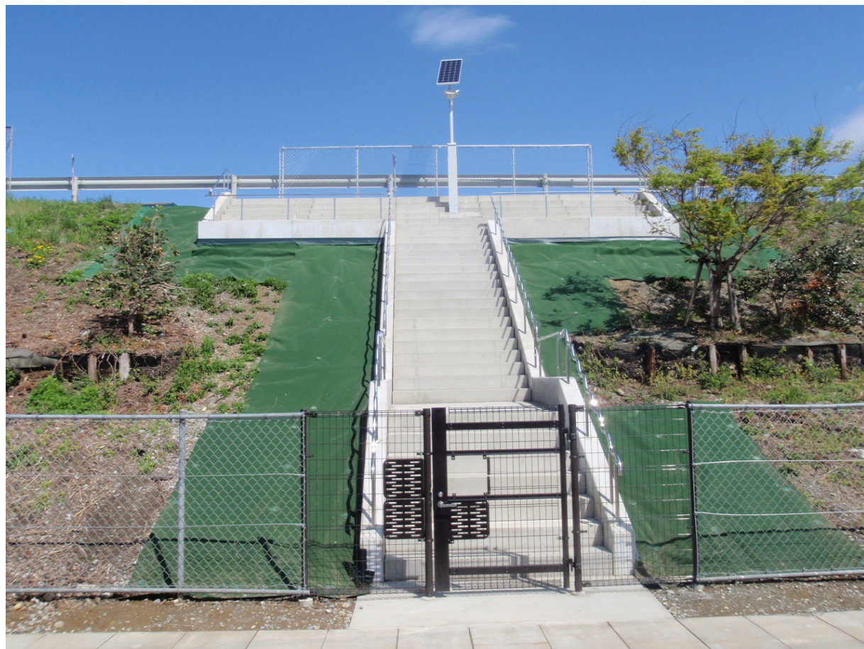
津波避難階段全景(新金沼)