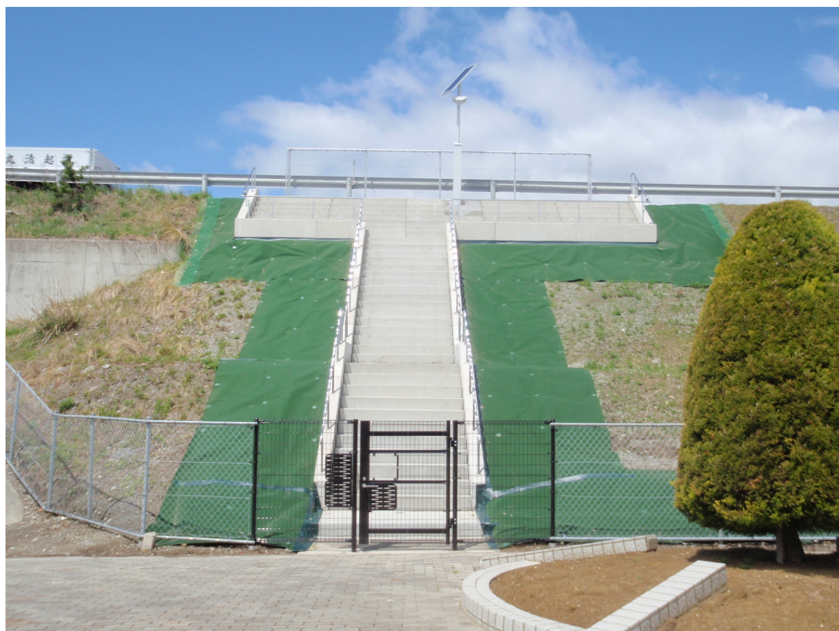
津波避難階段全景(あけぼの)