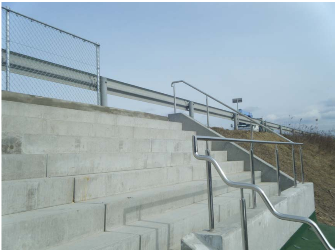
津波避難階段上部