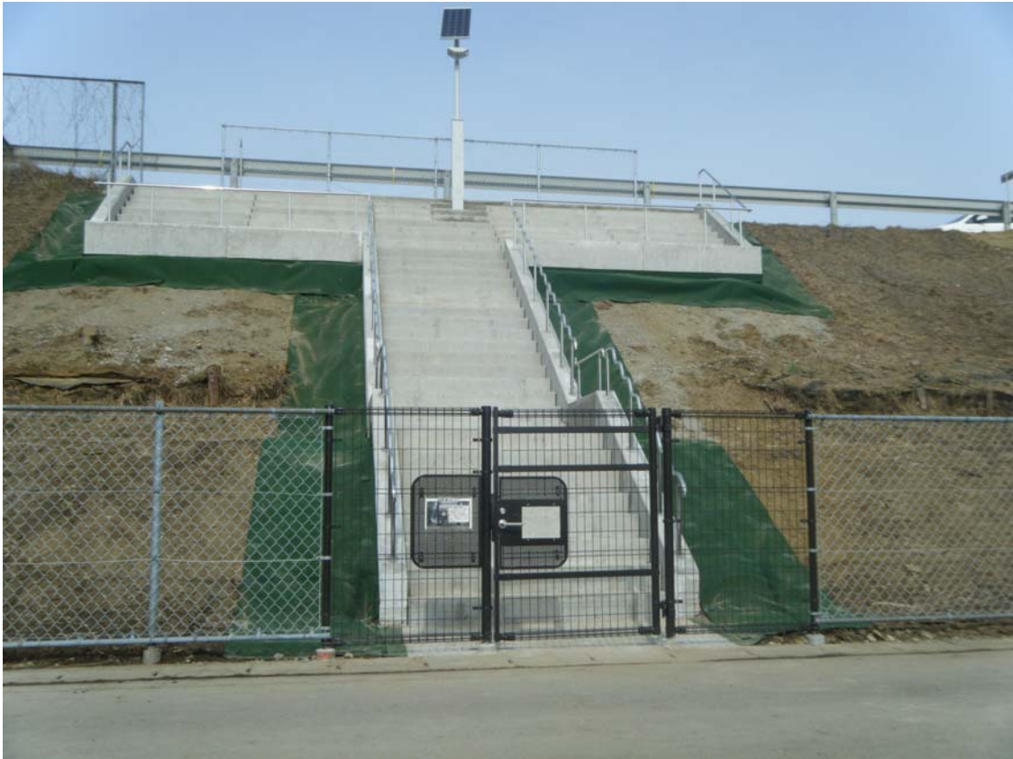
津波避難階段全景