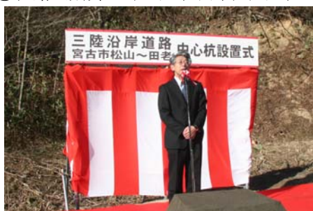
▲三陸国道事務所長の挨拶