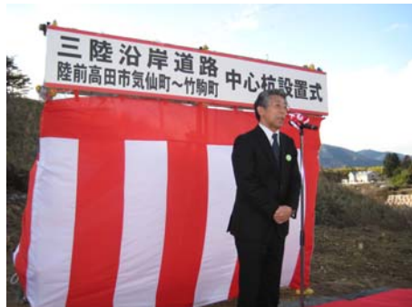
▲三陸国道事務所長の挨拶