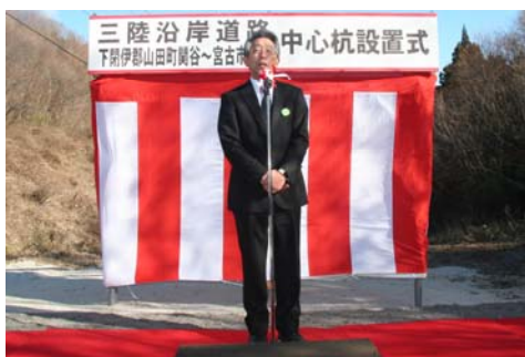
▲三陸国道事務所長の挨拶