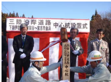
▲山田町長による中心杭打設