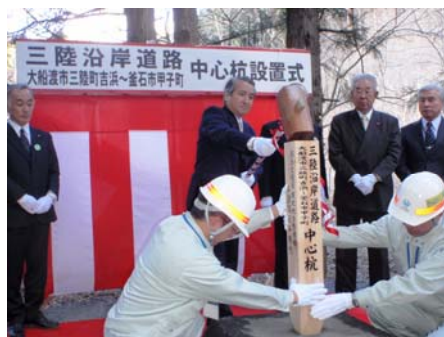
▲釜石市長による中心杭打設