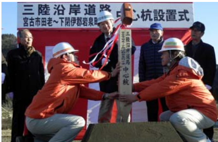
▲岩泉町長による中心杭打設