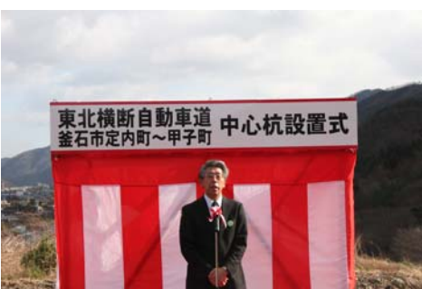
▲三陸国道事務所長の挨拶