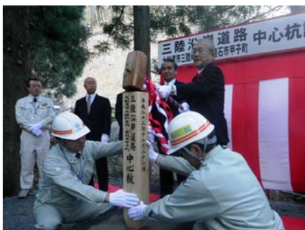
▲大船渡市長による中心杭打設