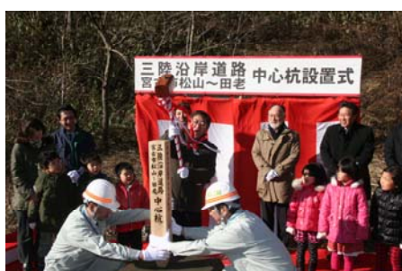
▲宮古市長による中心杭打設