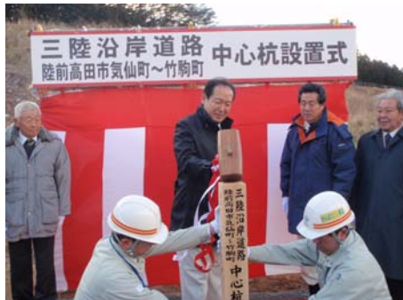
▲陸前高田市長による中心杭打設