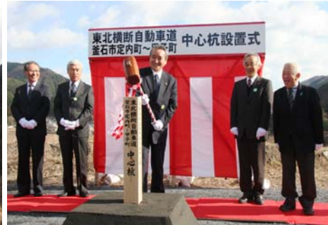
▲釜石市長による中心杭打設