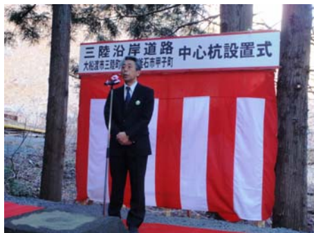
▲三陸国道事務所長の挨拶