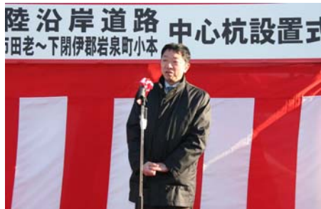
▲三陸国道事務所副所長の挨拶