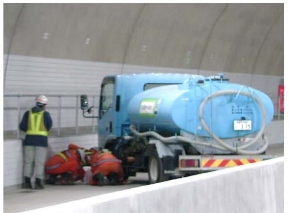
▲危険物流出処理訓練