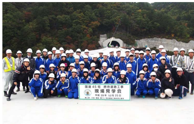
▲現場見学会参加者全員で記念撮影