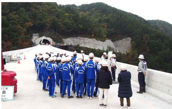
▲施工業者から摂待大橋について説明