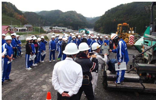
▲見学会の最後に、各種機械の用途を説明