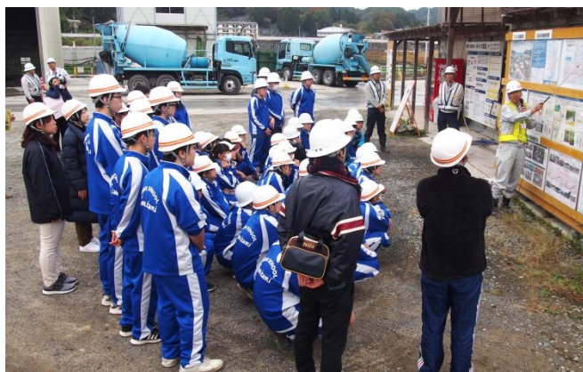
▲建設監督官から工事概要を説明