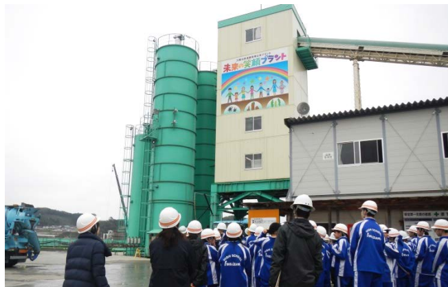
▲公共プラントを見学