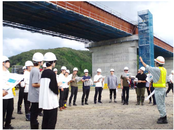
▲閉伊川橋南側(河川部上部工)の工事内容を説明中