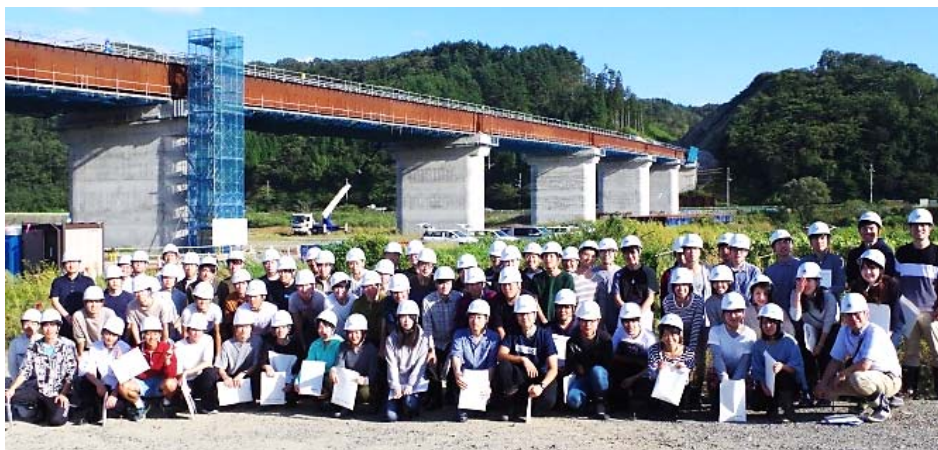
▲建設中の閉伊川橋を背景に記念撮影