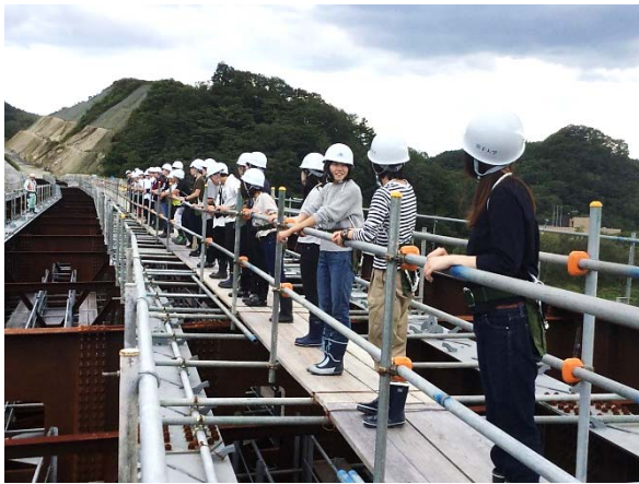
▲閉伊川橋上部工の施工状況を見学