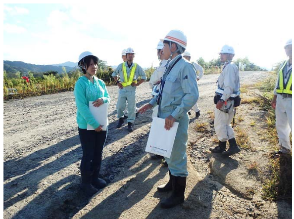
▲積極的に質問する岩手大学理工学部の学生