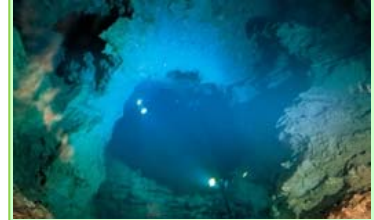
(岩泉町入込客数：43万人/年)