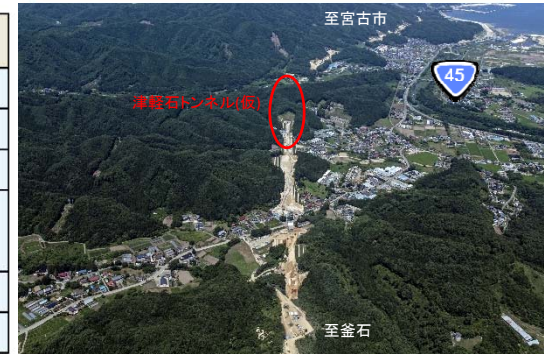
津軽石弘川から宮古市側を望む