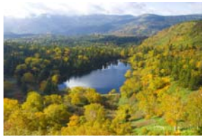
八幡平 (八幡平市入込客数：175万人/年)