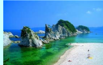
(宮古市入込客数：122万人/年)