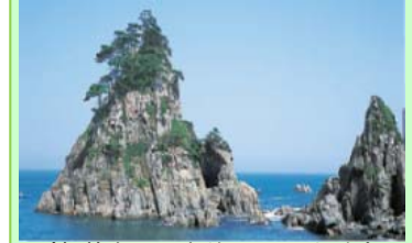
(久慈市入込客数：79万人/年)