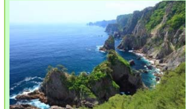
(田野畑村入込客数：55万人/年)