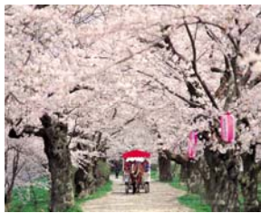
展勝地 (北上市入込客数：133万人/年)