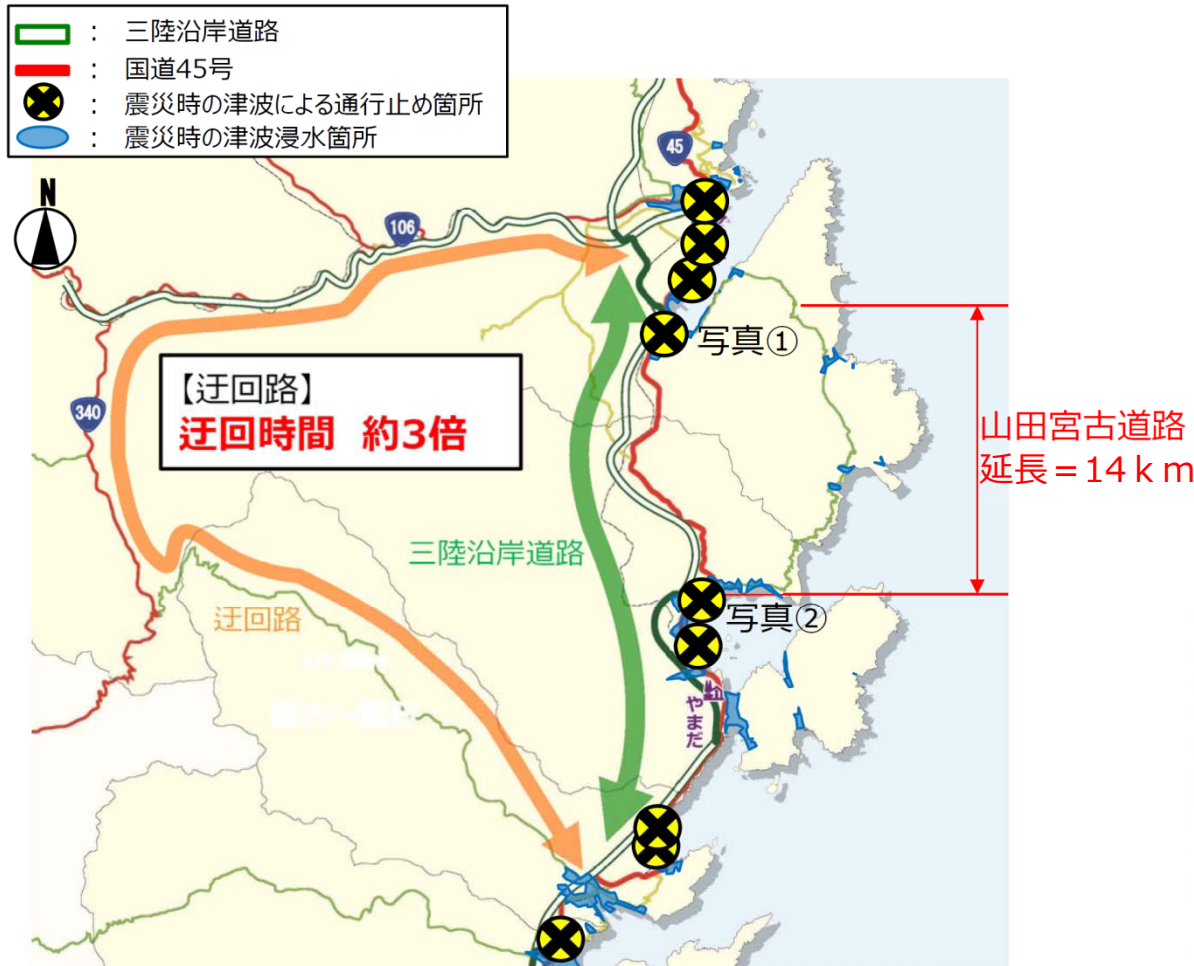
▼山田町～宮古市間経路