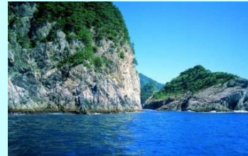
(山田町入込客数：23万人/年)