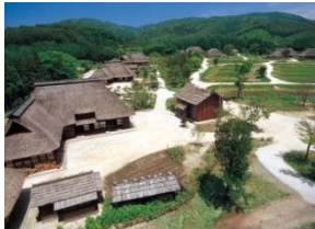
遠野盆地 (遠野市入込客数：168万人/年)