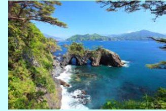
(大船渡市入込客数：100万人/年)