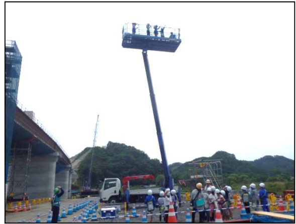
▲地上から高所作業車を眺める