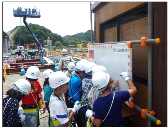
▲見学感想コーナーにメッセージ書き込み