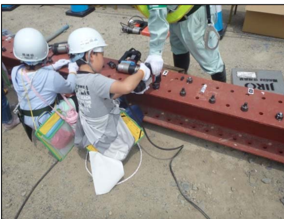
▲高圧ボルト締め付けの様子