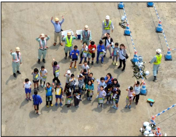
▲高所作業車から地上を眺める