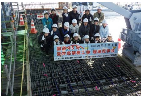
▲ジョイントシースと一緒に記念撮影