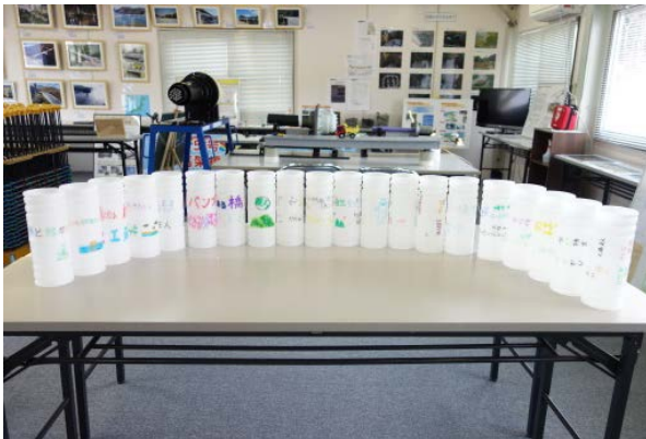
▲児童一人ひとりがメッセージやイラストを書きました