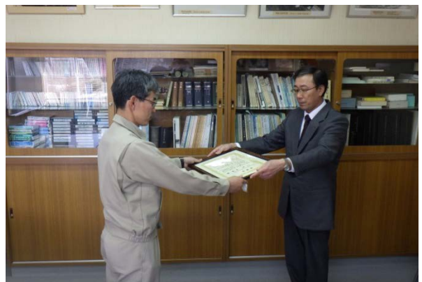
▲校長先生から感謝状をいただきました