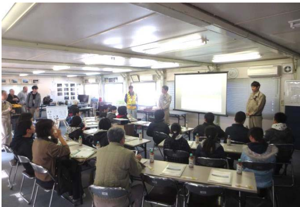
▲工事概要説明の様子