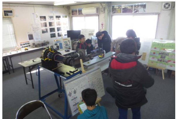
▲橋の構造について模型を見ながら学びました