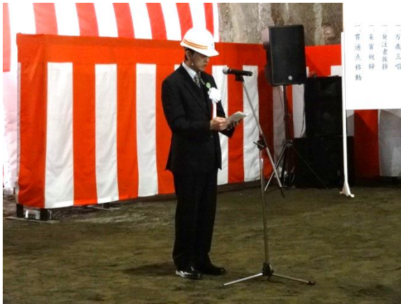
▲三陸国道事務所長挨拶