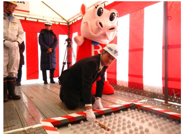
▲ボルト締結の様子