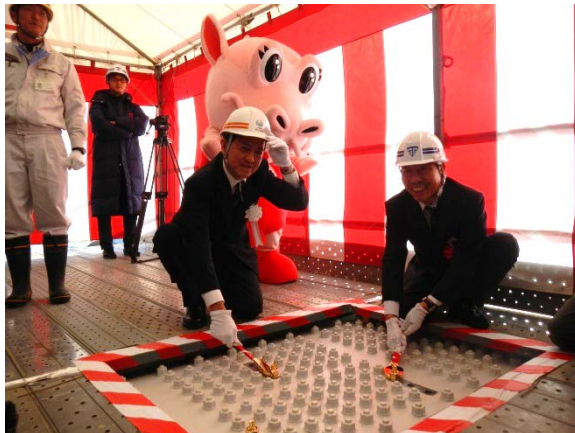
▲金色のボルトで締結完了