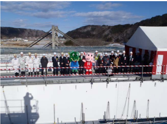
▲関係者一同で記念撮影