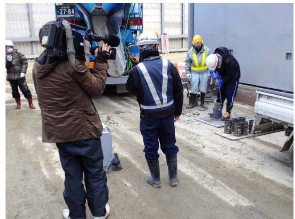
▲コンクリート試験実体験