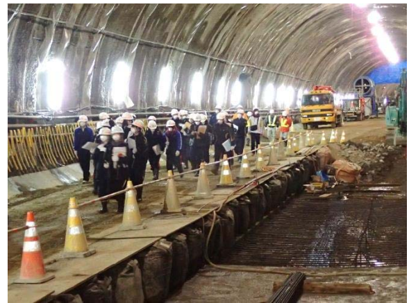
▲トンネル坑内見学の様子