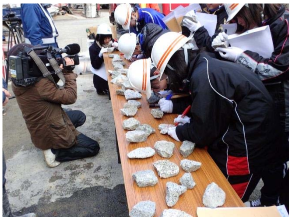
▲記念石作成の様子