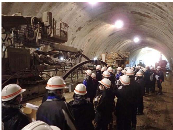
▲トンネル坑内見学の様子