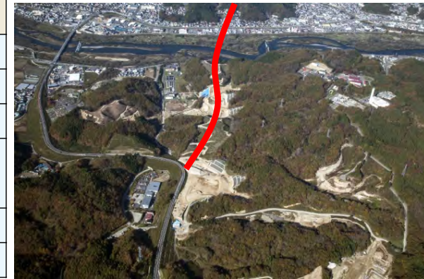
宮古中央IC付近(北側を望む)