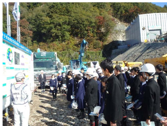
▲工事概要説明の様子▲