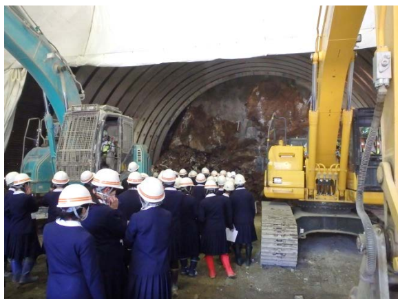
▲トンネル見学の様子