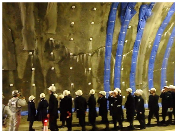
▲トンネル坑内見学の様子