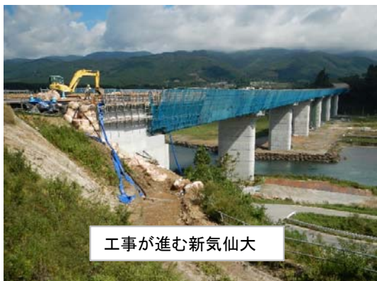
工事が進む新気仙大