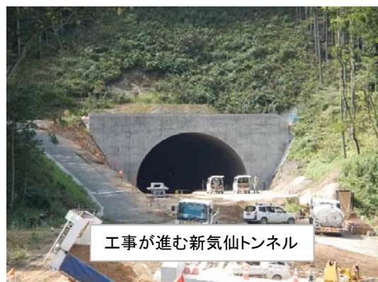
工事が進む新気仙トンネル