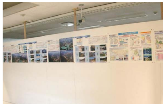
▲パネル展示状況 (マリコープDORA)