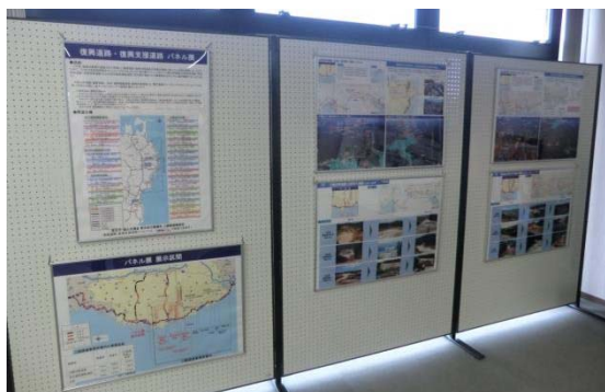
▲パネル展示状況 (道の駅みやこ)