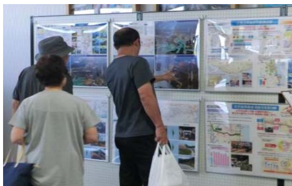
▲パネル展開催状況(道の駅みやこ)