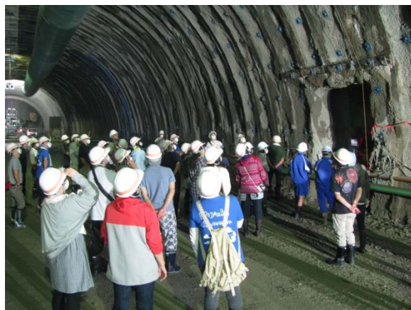
▲トンネル内の見学の様子