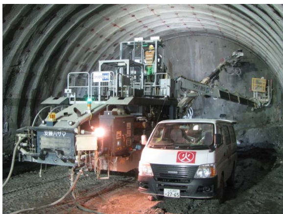
▲ジャンボドリルの実演