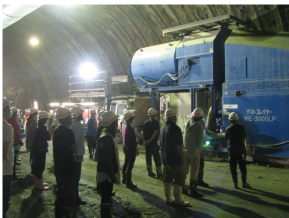
▲トンネル内の見学の様子