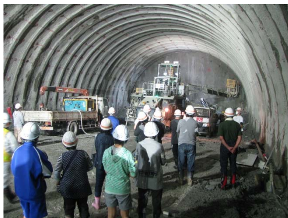
▲ドリルジャンボの見学