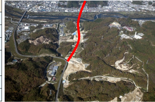
宮古中央IC付近(北側を望む)