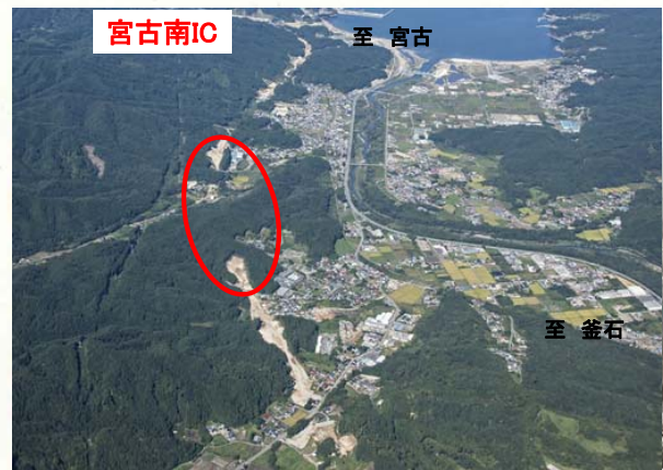
津軽石から宮古南ICを望む