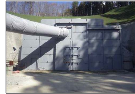
▲坑口 (トンネル発破音)