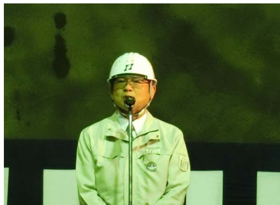
▲施工者挨拶 (株)安藤・間 東北支店 常務執行役員支店長)