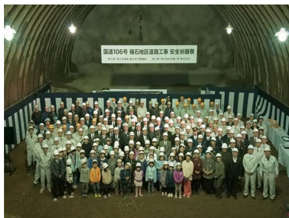
▲出席者全員による記念撮影