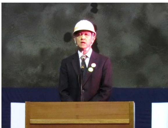
▲三陸国道事務所長挨拶