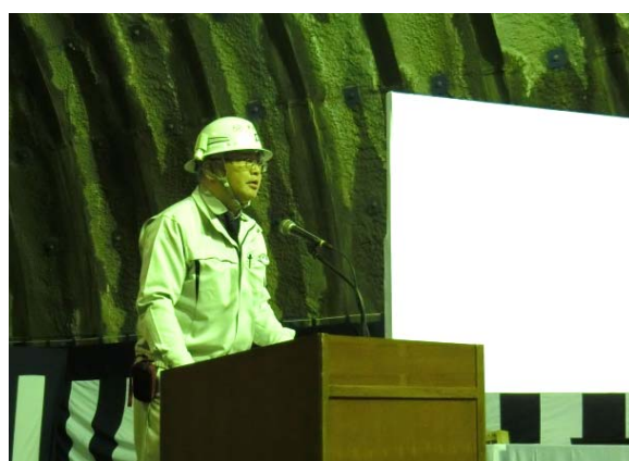
▲工事概要説明(箱石地区道路工事 現場代理人)