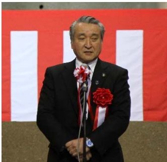
▲来賓祝辞(釜石市長)