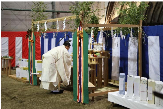
▲安全祈願祭・玉串奉奠