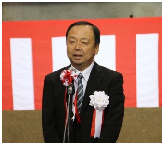
▲発注者挨拶 (南三陸国道事務所長)