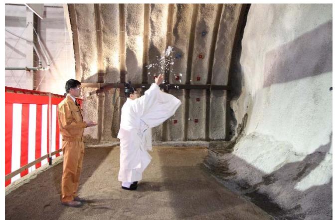
▲安全祈願祭・切麻散米