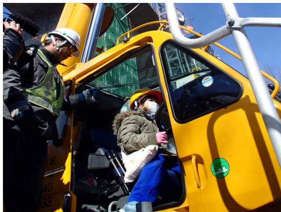
▲高所作業車の試乗体験