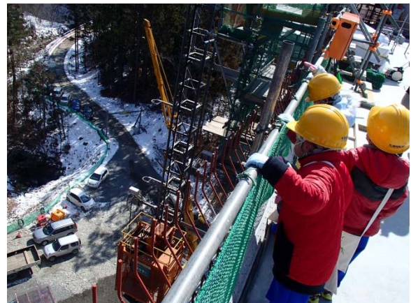
▲架設中の橋桁最上部より見学