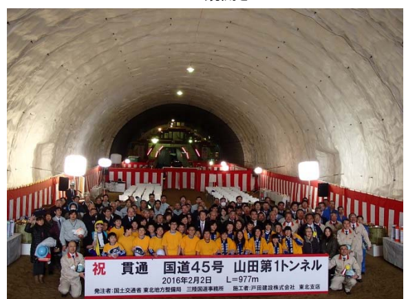
▲出席者全員による記念撮影