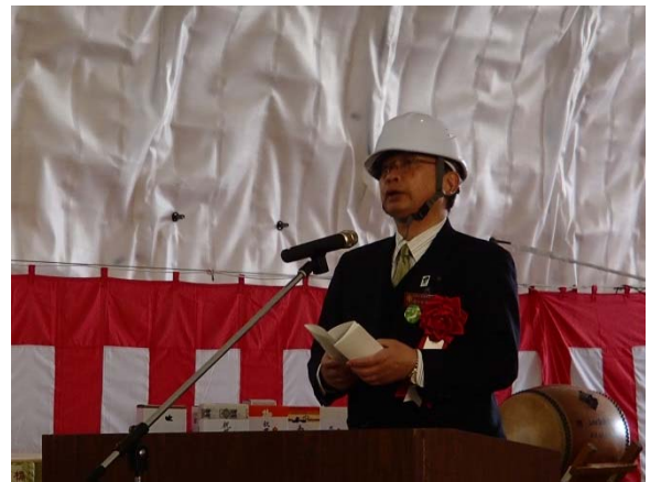
▲山田町長による来賓祝辞