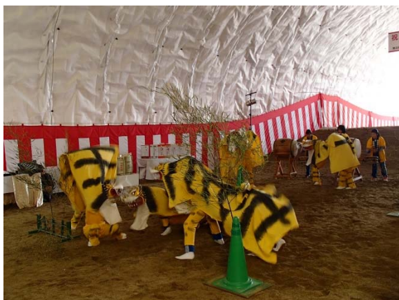
▲山田南小学校児童による「南小虎舞」