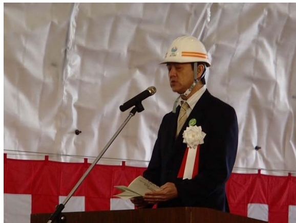
▲三陸国道事務所長による事業者挨拶