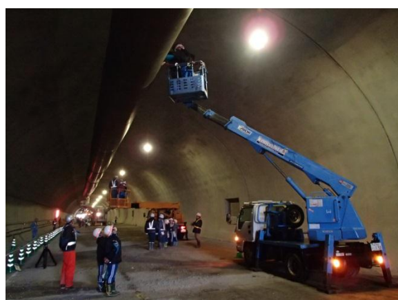
▲高所作業車の試乗体験