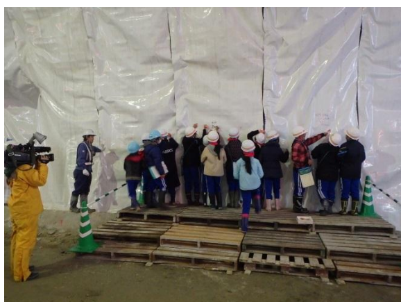
▲防水シートにメッセージを書きました