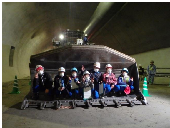
▲搭乗体験(トラクターショベル)