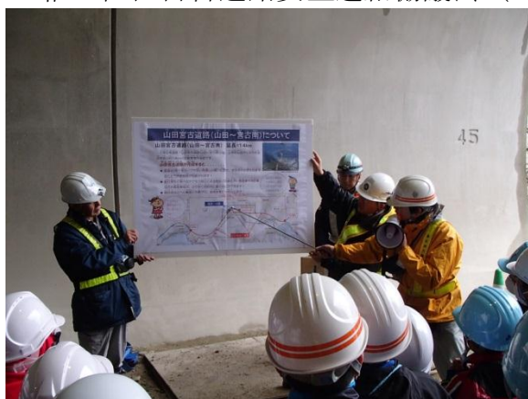
▲工事業者による工事概要の説明