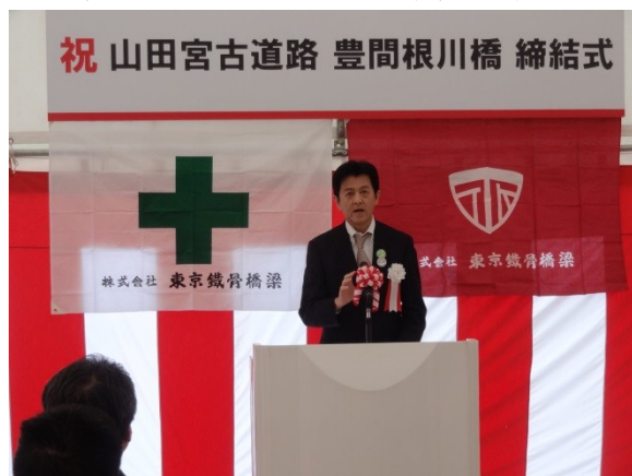
▲挨拶(三陸国道事務所長)