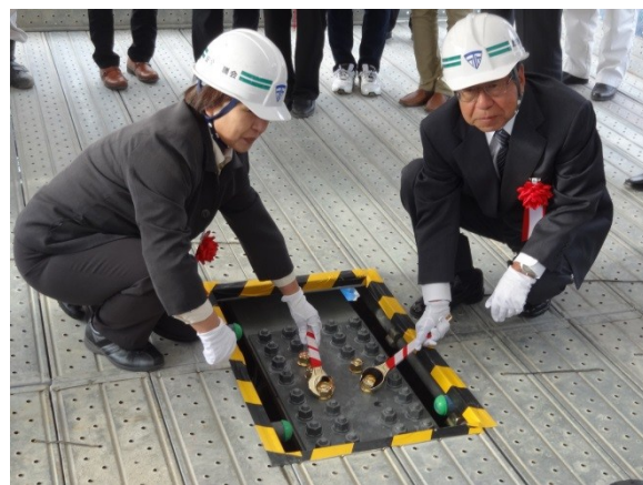
▲ボルト締結(地域住民)