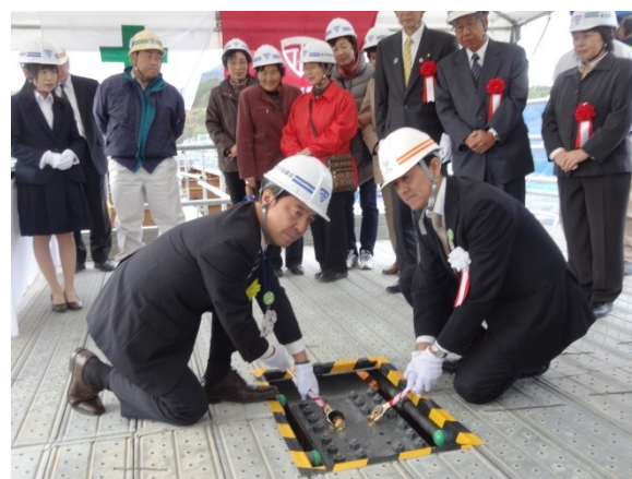
▲ボルト締結(国・県)