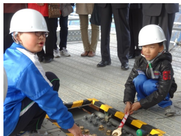
▲ボルト締結(小学生)