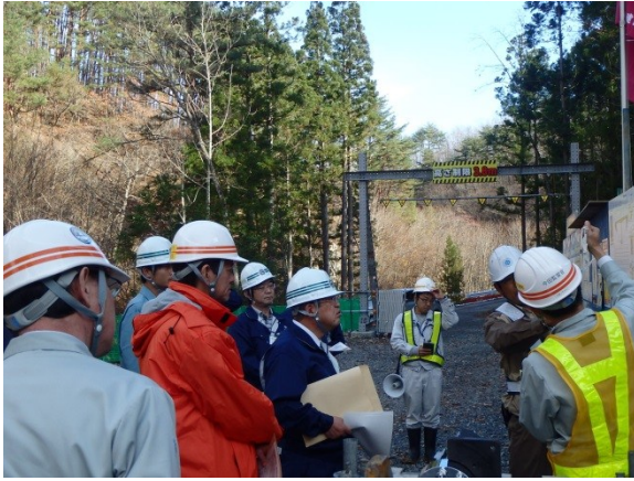
▲三陸国道担当者から工事概要の説明

見学場所：「宮古田老道路」（青の滝川橋、山口第2トンネル）・「山田宮古道路」（津軽石トンネル、豊間根トンネル、インフォメーションセンター）