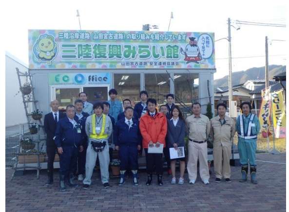
▲参加者全員で集合写真