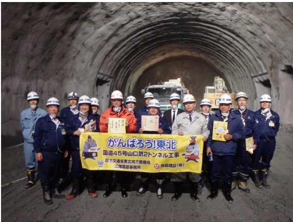
▲「山口第2トンネル」切羽付近で記念撮影