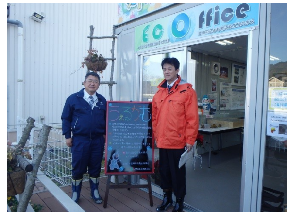
▲「山田宮古道路インフォメーションセンター」展示会場