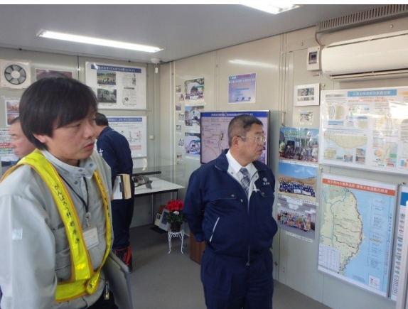
▲会場内で熱心に見学されました