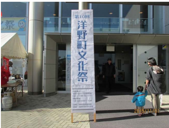
▲パネル展会場（洋野町文化祭）

内容：復興道路（三陸沿岸道路「洋野階上道路（待浜～階上）」）の概要、進捗状況、整備効果についてまとめたパネル