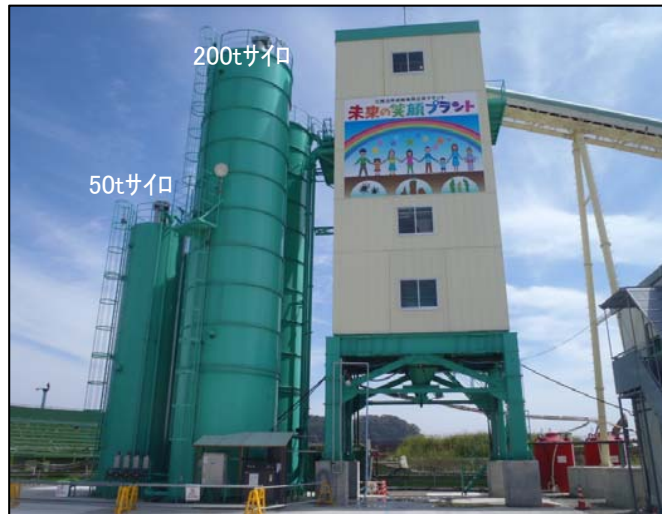
バッチャープラントとセメントサイロ