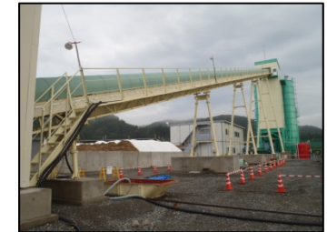
ベルトコンベア 60cm幅×61m