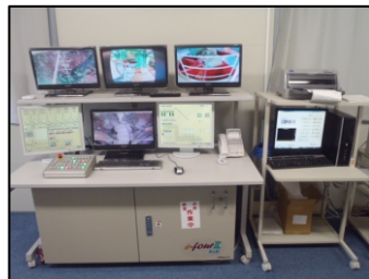
ミキシング操作室