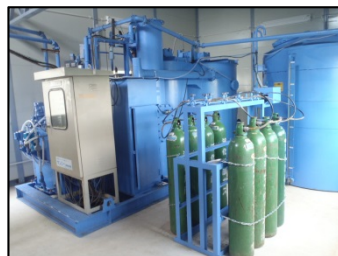
濁水処理設備 20m 3 /hr