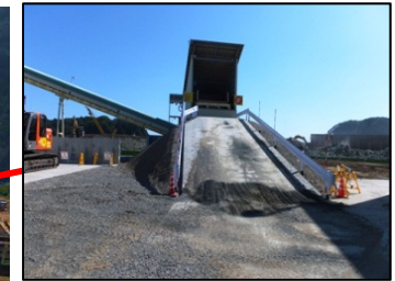
骨材投入ホッパー