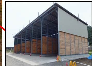
骨材貯蔵設備 (砂2種類・砂利2種類)