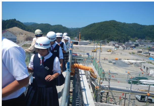
▲下部工最上部からの見学