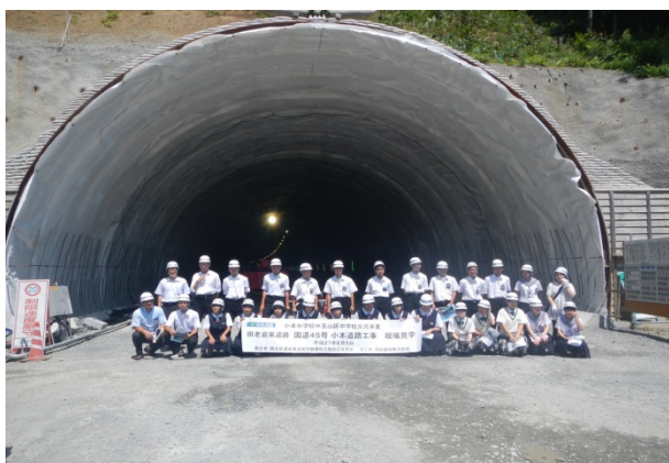
▲新小本トンネル坑口の前で記念撮影