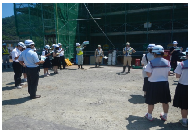
▲施工中の新小本大橋の説明