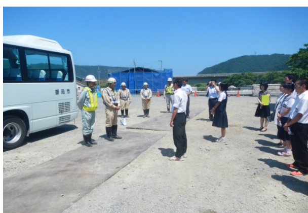
▲生徒代表者によるあいさつ