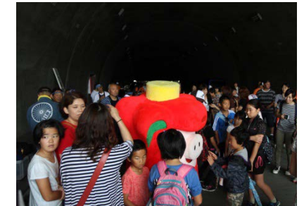
▲開催状況（トンネル内）