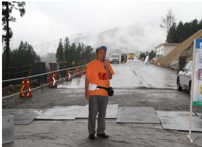
▲主催者挨拶（南三陸国道事務所長）