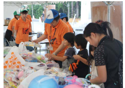
▲宝探し（景品交換所）