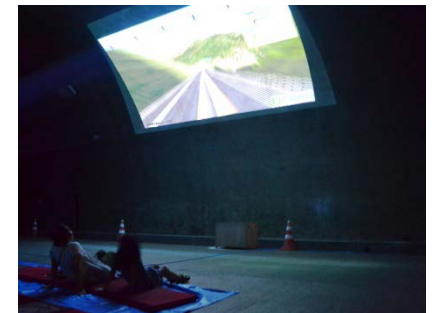
▲三沿道完成予想CG放映