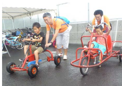
▲自転車で橋を渡ろう