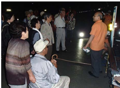
▲工事紹介コーナー