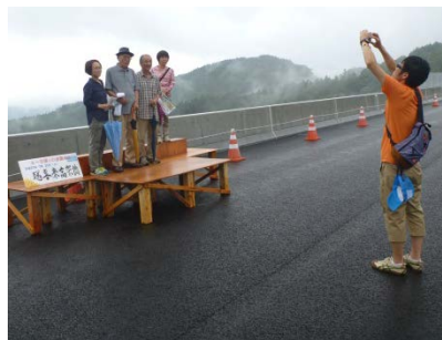
▲橋の上で記念撮影