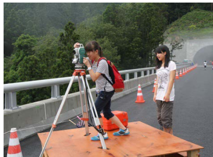
▲測量機器による景色観察